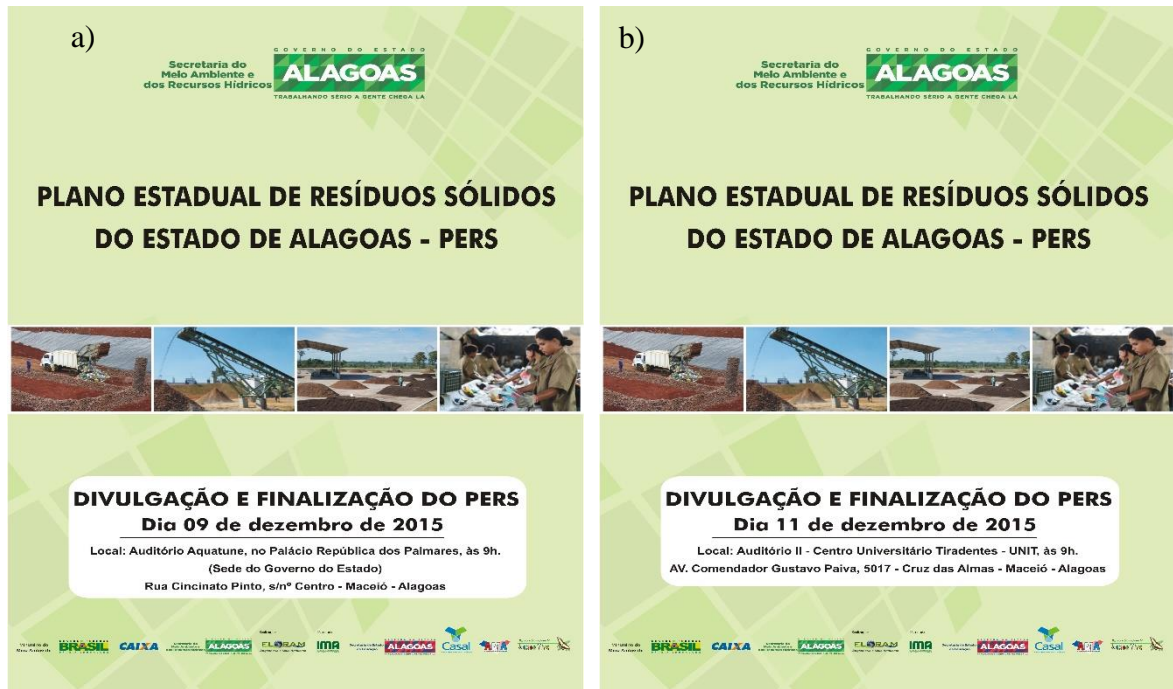
Figura 28.4, Fotos a) e b) - Modelos de cartazes por data de reunião que foram utilizados no processo de divulgação e finalização do PERS.