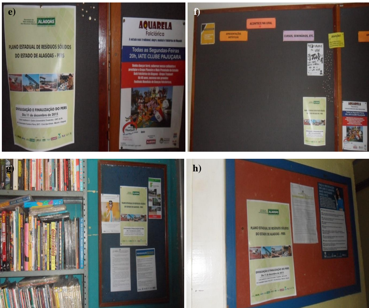
Figura 28.5, Fotos a) a h) - Cartazes afixados em pontos estratégicos para o processo de divulgação e finalização do PERS.