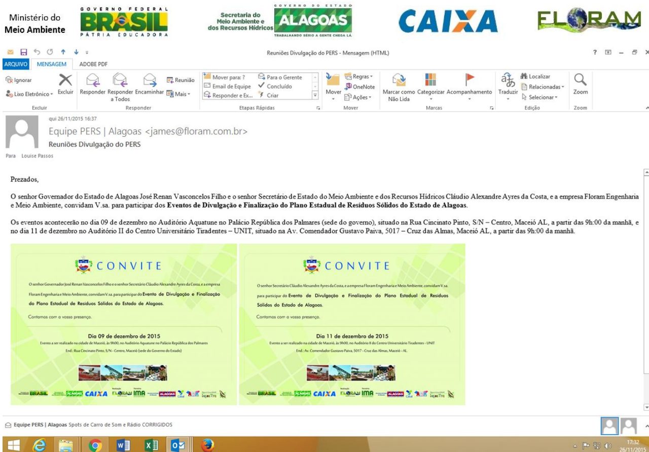
Figura 28.3 - Cópia de e-mail enviado pela Equipe PERS com convite para os Eventos de Divulgação e Finalização do Plano Estadual de Resíduos Sólidos no Estado de Alagoas.