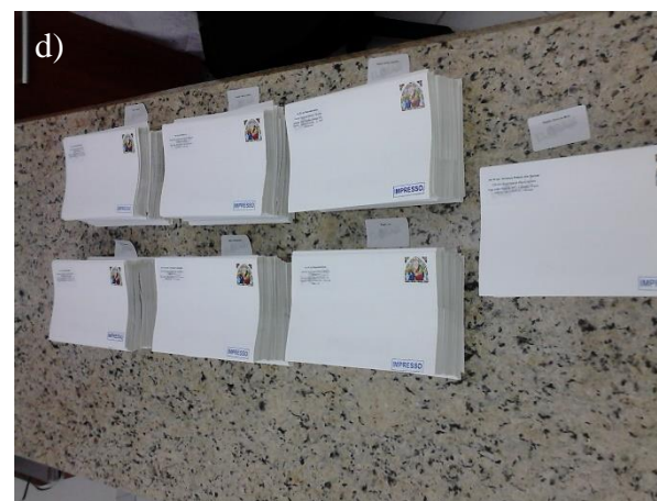
Figura 28.2, Fotos a) a d) - Produção e confecção dos convites, bem como, organização para despacho dos mesmos através do correio postal.

No Anexo 81 é apresentada os modelos dos convites para os Eventos de Divulgação e Finalização do PERS. Esses convites foram encaminhados aos atores e instituições do banco de dados contidos no PERS e seu comprovante de envio é apresentado no Anexo 82.