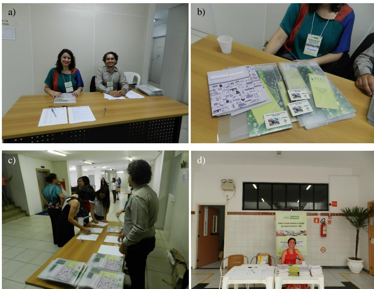
Figura 28.1, Fotos a) a d) - Evidências do processo de inscrição e recebimento dos materiais de divulgação do Plano nos eventos dos dias 09/12/2015 e 11/12/2015.

As listas de presença de ambas as reuniões se encontram no Anexo 78. As evidências do processo de organização dos kits de divulgação do Plano, são apresentadas na Figura 28.1.