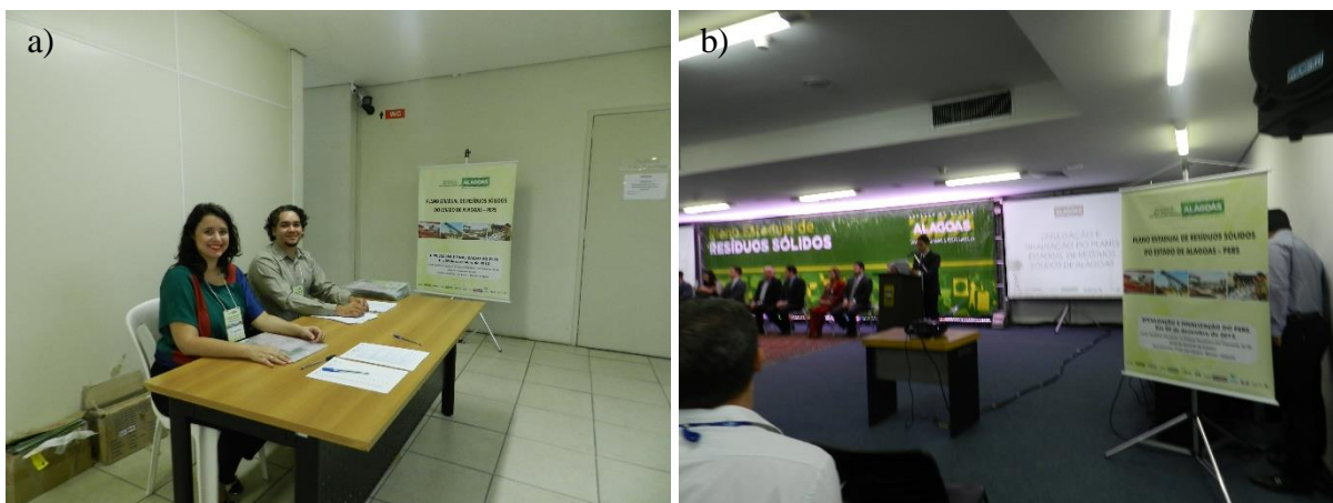
Figura 28.6, Fotos a) e b) - Banner exposto no interior do local da reunião pública no município de Maceió, referente ao Evento de Divulgação e finalização do PERS do dia 09 de dezembro de 2015.

Em cada Evento de Divulgação e Finalização, os banners foram posicionados na parte frontal externa e interna dos auditórios com visibilidade para os participantes (Figura 28.6 e Figura 28.7).