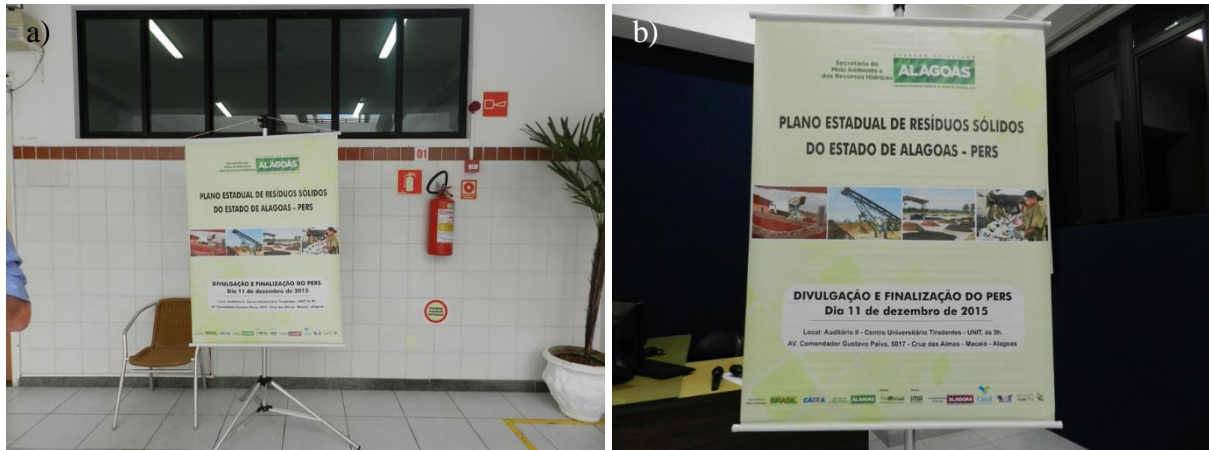
Figura 28.7, Fotos a) e b) - Banner exposto no interior do local da reunião pública no município de Maceió, referente ao Evento de Divulgação e Finalização do PERS do dia 11 de dezembro de 2015.