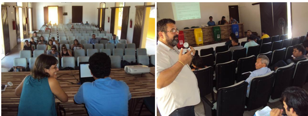
Figura 8 - Reuniões Públicas de Validação do Diagnóstico da Gestão de Resíduos Sólidos no Estado de Alagoas, realizada em abril de 2014, no município de Piranhas.

Embora o número de participantes seja baixo nas reuniões realizadas até o momento, deve-se destacar que a participação dos presentes nas reuniões geralmente é produtiva, através de questionamentos e sugestões às proposições do PERS apresentadas na região.