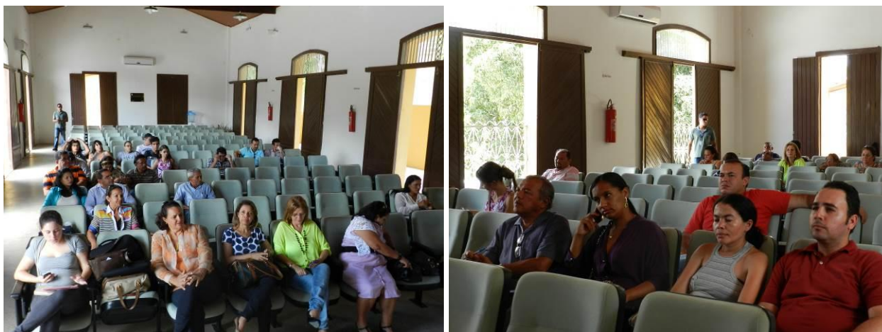
Figura 7 – Reunião com o Comitê Diretor da Região do Sertão Alagoano, realizada em fevereiro de 2014, no município de Piranhas.