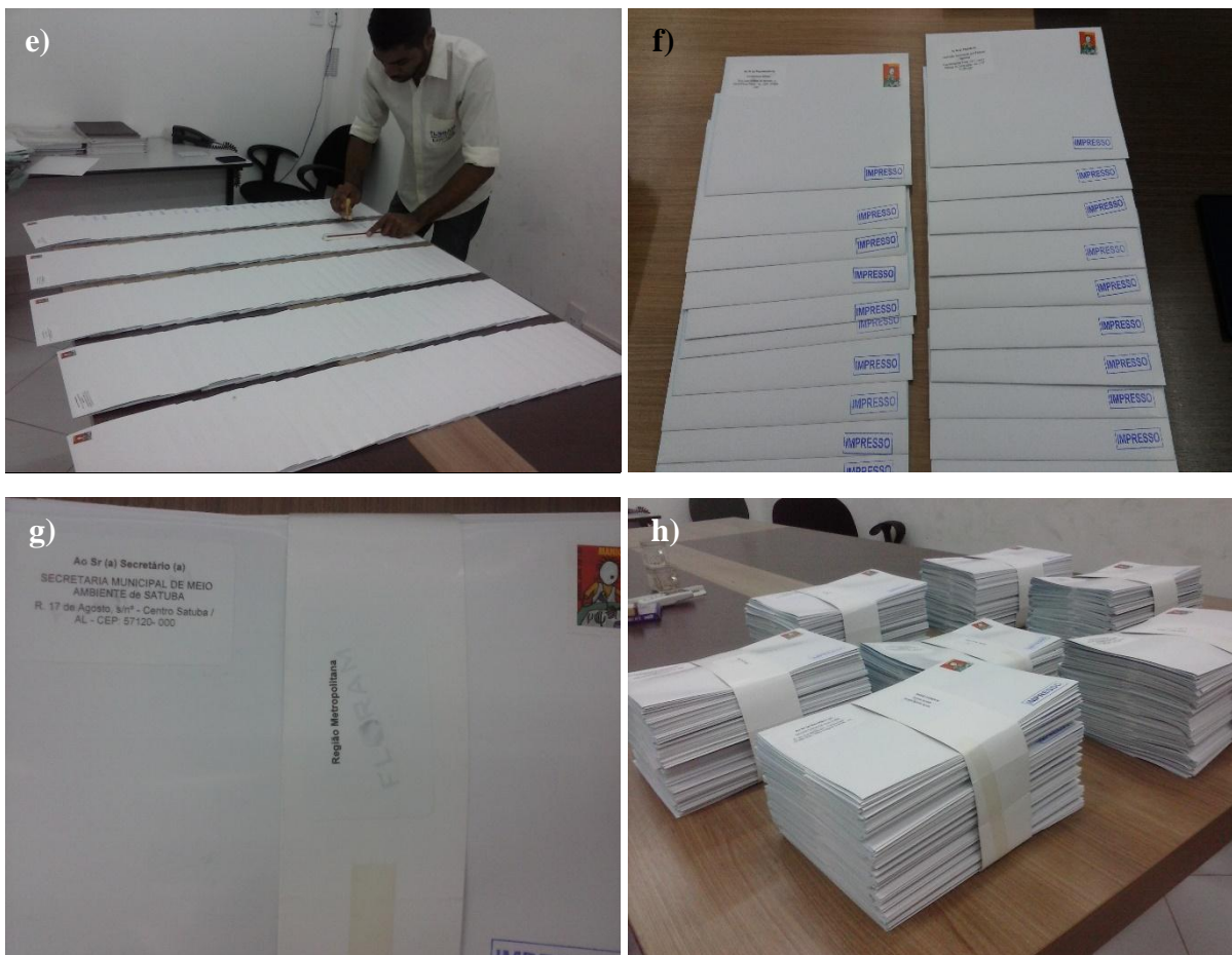
Figura 2, Fotos a) a h) – Produção e confecção dos convites, bem como, organização para despacho dos mesmos através do correio postal.

No Anexo 4 é apresentado o modelo do convite para os Evento de Divulgação do PIGIRS para a região Sul do Estado de Alagoas. Além dos convites específicos para a região Sul, também foram elaborados convites especiais que continham as datas das reuniões do PIGIRS considerando as sete regiões de Planejamento definidas para o Estado de Alagoas, conforme apresentado no Anexo 5. Os convites foram encaminhados aos atores e instituições do banco de dados contidos no PIGIRS e seu comprovante de envio é apresentado no Anexo 6.