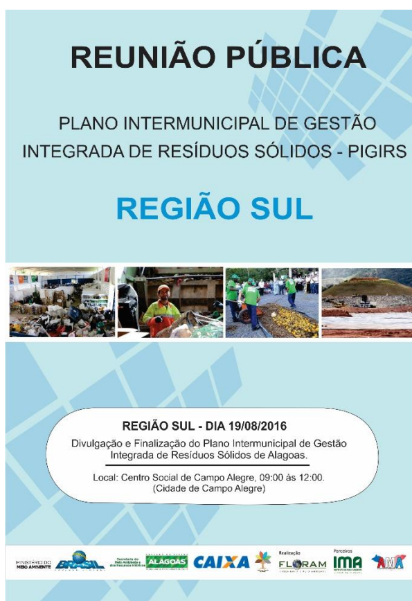
Figura 6 – Layout do banner que foi utilizado no Evento de Divulgação e finalização do PIGIRS.

No Evento de Divulgação do PIGIRS da região Sul do Estado de Alagoas, o banner foi posicionado na parte frontal interna do local de reunião com visibilidade para os participantes. Na Figura 6 é apresentado o layout do banner, e na Figura 7 é demonstrado o banner exposto no local da reunião.