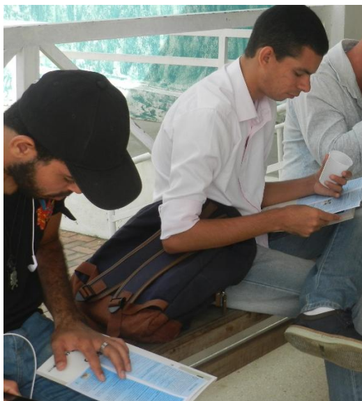
Figura 4 - Evidência da distribuição dos Folders na reunião pública do PIGIRS Região Agreste.

O folder contendo o resumo do PIGIRS para a região Sul foi distribuído para os participantes presentes no evento de divulgação do Plano (Figura 4). A evidência de organização dos folders é demonstrada na Figura 6 enquanto que o layout do folder é apresentado no Anexo 9.