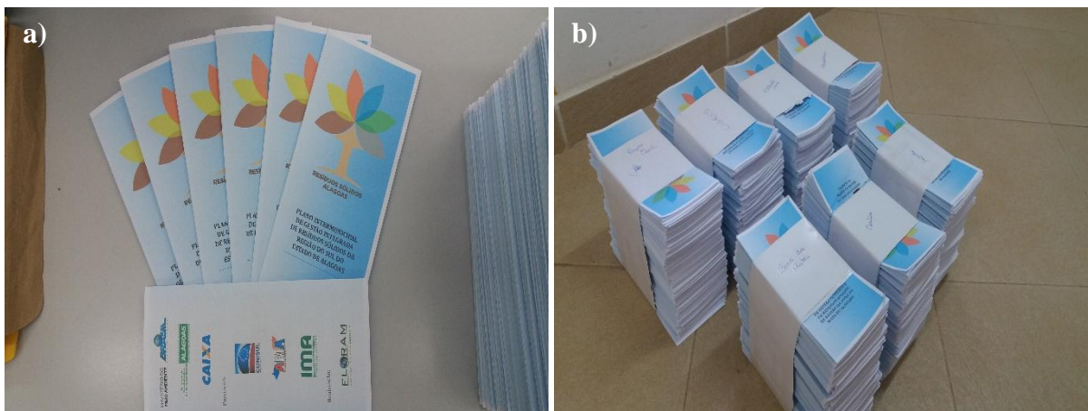
Figura 5, Fotos a) e b) – Evidência de organização dos folders para evento de Divulgação do PIGIRS.