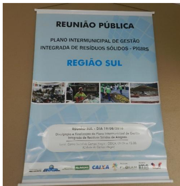
Figura 7 – Banner exposto no interior do local da reunião pública no município de Campo Alegre, referente ao Evento de Divulgação e finalização do PIGIRS.