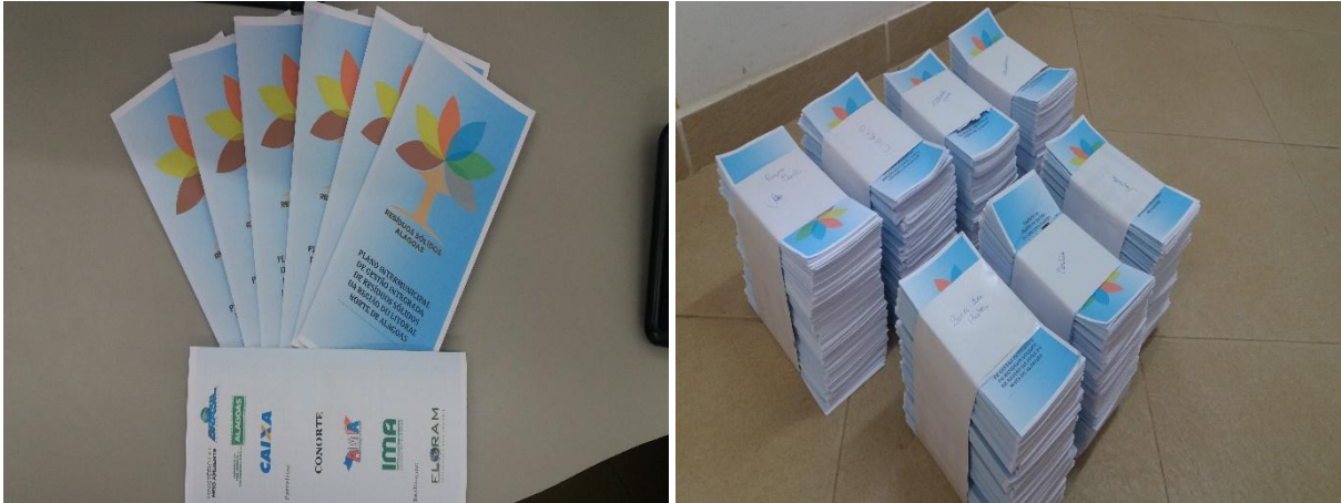
Figura 5 – Evidência de organização dos folders para evento de Divulgação do PIGIRS.