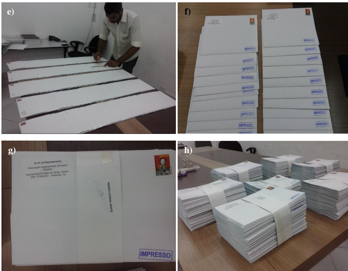
Figura 2, Fotos a) a h) – Produção e confecção dos convites, bem como, organização para despacho dos mesmos através do correio postal.

No Anexo 4 é apresentado o modelo do convite para os Evento de Divulgação do PIGIRS para a região do Litoral Norte Alagoano. Além dos convites específicos para a região do Litoral Norte, também foram elaborados convites especiais que continham as datas das reuniões do PIGIRS considerando as sete regiões de Planejamento definidas para o Estado de Alagoas, conforme apresentado no Anexo 5. Os convites foram encaminhados aos atores e instituições do banco de dados contidos no PIGIRS e seu comprovante de envio é apresentado no Anexo 6.