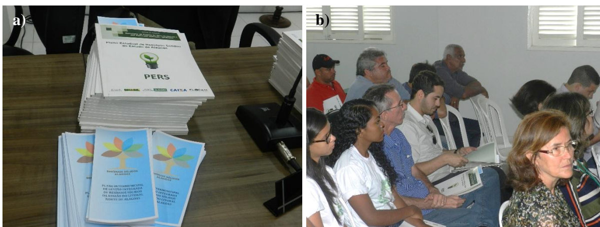
Figura 1, Fotos a) e b) – Evidência do processo de organização e distribuição dos materiais de divulgação dos Planos Estadual e Intermunicipal. *A cartilha explicativa do Plano Estadual de Resíduos Sólidos – PERS foi entregue aos participantes que compareceram ao evento de Divulgação do PIGIRS.

A lista de presença da reunião se encontra no Anexo 1. A evidência do processo de organização e distribuição dos materiais de divulgação dos Planos (Estadual e Intermunicipal) no evento, é apresentada na Figura 1.