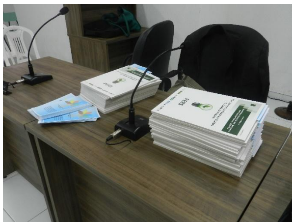
Figura 4 - Evidência da distribuição dos Folders na reunião pública do PIGIRS da Região do Litoral Norte.

O folder contendo o resumo do PIGIRS para a região do Litoral Norte Alagoano foi distribuído para os participantes presentes no evento de divulgação do Plano (Figura 5). A evidência de organização dos folders é demonstrada na Figura 6 enquanto que o layout do folder é apresentado no Anexo 9.