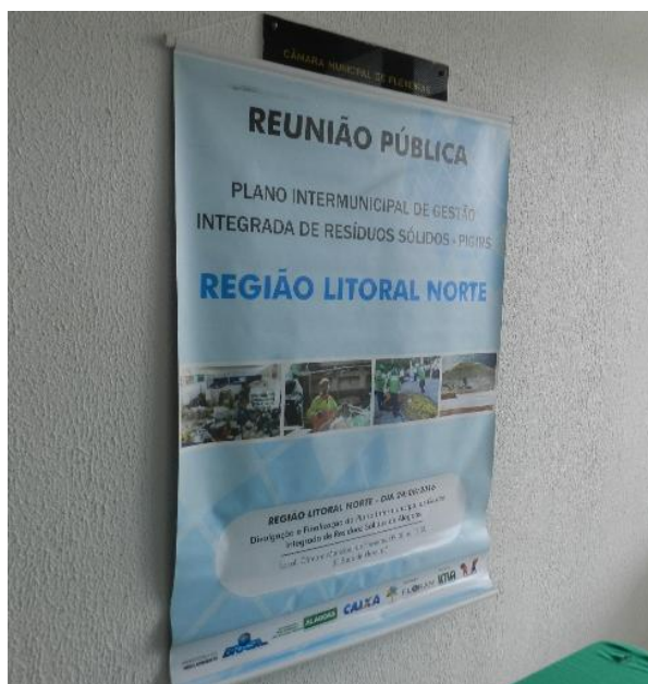
Figura 7 – Banner exposto no interior do local da reunião pública no município de Flexeiras, referente ao Evento de Divulgação e finalização do PIGIRS.