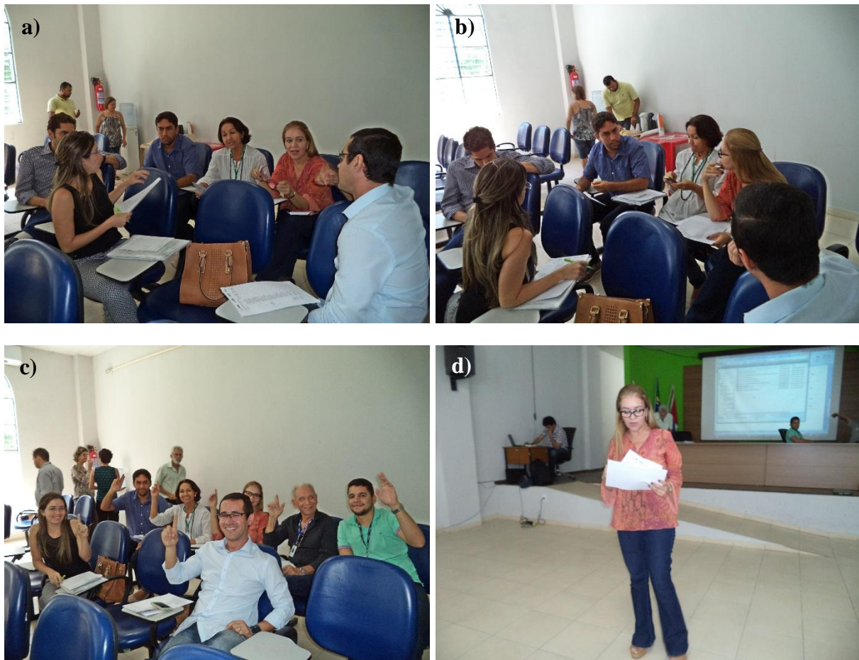
Figura 14, Fotos a) à d) – Registro dos trabalhos do Grupo 3.

A reunião pública da região Metropolitana ocorreu conforme metodologia prevista, cujo maior objetivo foi apresentar as proposições e validar o Planejamento das ações para a Gestão Intermunicipal dos Resíduos Sólidos de Alagoas.