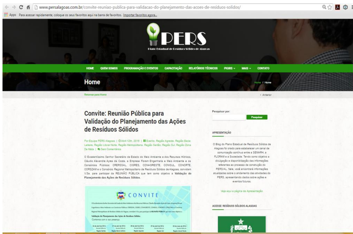
Figura 8 – Recorte da publicação do convite para as reuniões do PIGIRS, extraída da blog do PERS.

A reportagem pode ser acessada através da página http://www.persalagoas.com.br/convite-reuniao-publica-para-validacao-do-planejamento-das-acoes-de-residuos-solidos/ . O recorte da página do blog com a publicação do convite é apresentado na Figura 8 e no Anexo 9.