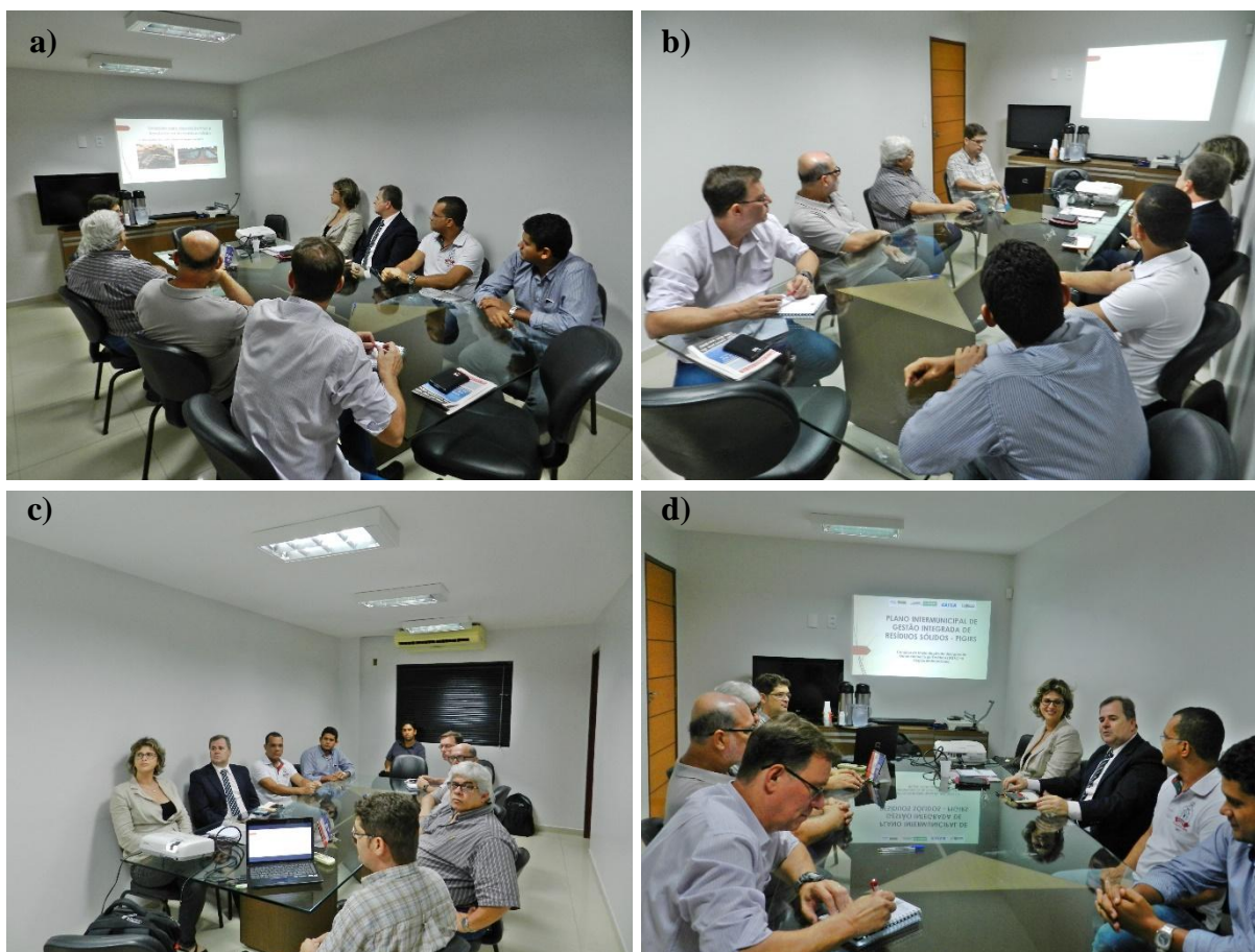
Figura 18 – Registros da reunião do Consórcio com o Poder Público da Região Metropolitana do Estado de Alagoas.

A lista de presença, bem como, os registros fotográficos da reunião do consórcio, são apresentadas no Anexo 21 e Figura 18, respectivamente.