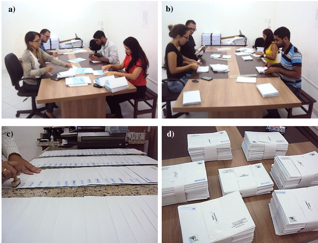
Figura 1 – Fotos a) a d) Processo de confecção dos convites, bem como, organização para despacho dos mesmos através do correio postal.