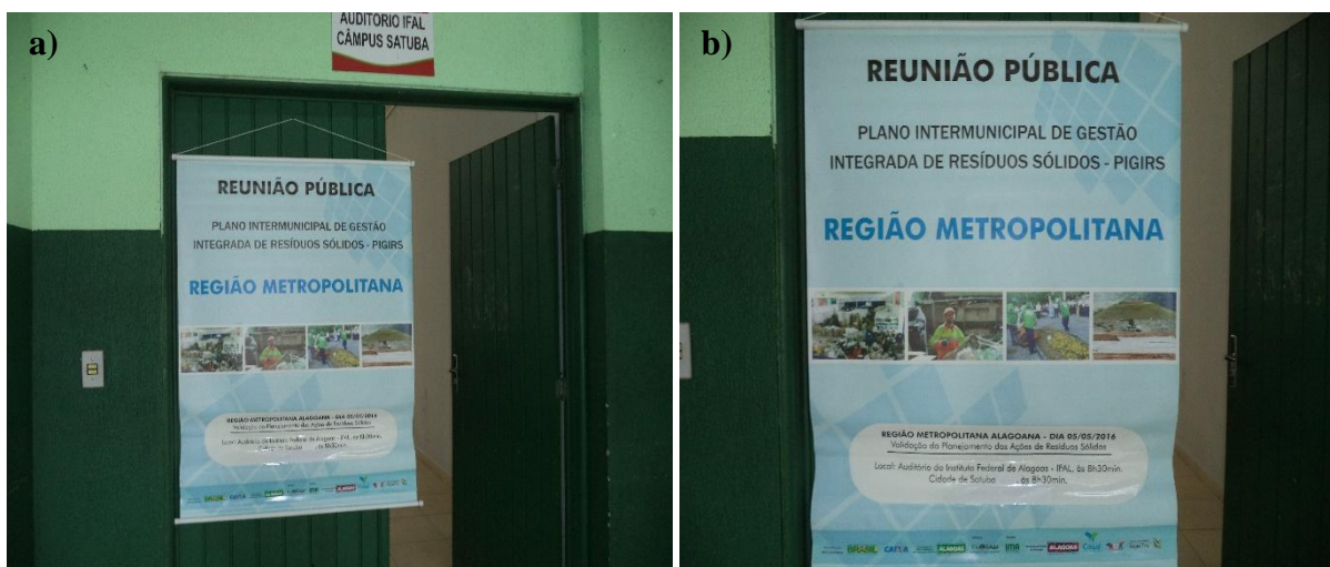
Figura 7, Fotos a) e b) Banner exposto na entrada do local da reunião pública no município de Satuba, durante a reunião pública para Validação do Planejamento das Ações para a Gestão Intermunicipal dos Resíduos Sólidos da Região Metropolitana do Estado de Alagoas.

O Banner fora exposto no local da reunião, posicionados na parte frontal externa e interna do auditório, identificando que o evento estava em andamento; ainda continha informações como: nome do evento, região, data e endereço da reunião, propósito da reunião e logotipos dos organizadores e apoiadores do evento (Figura 7).