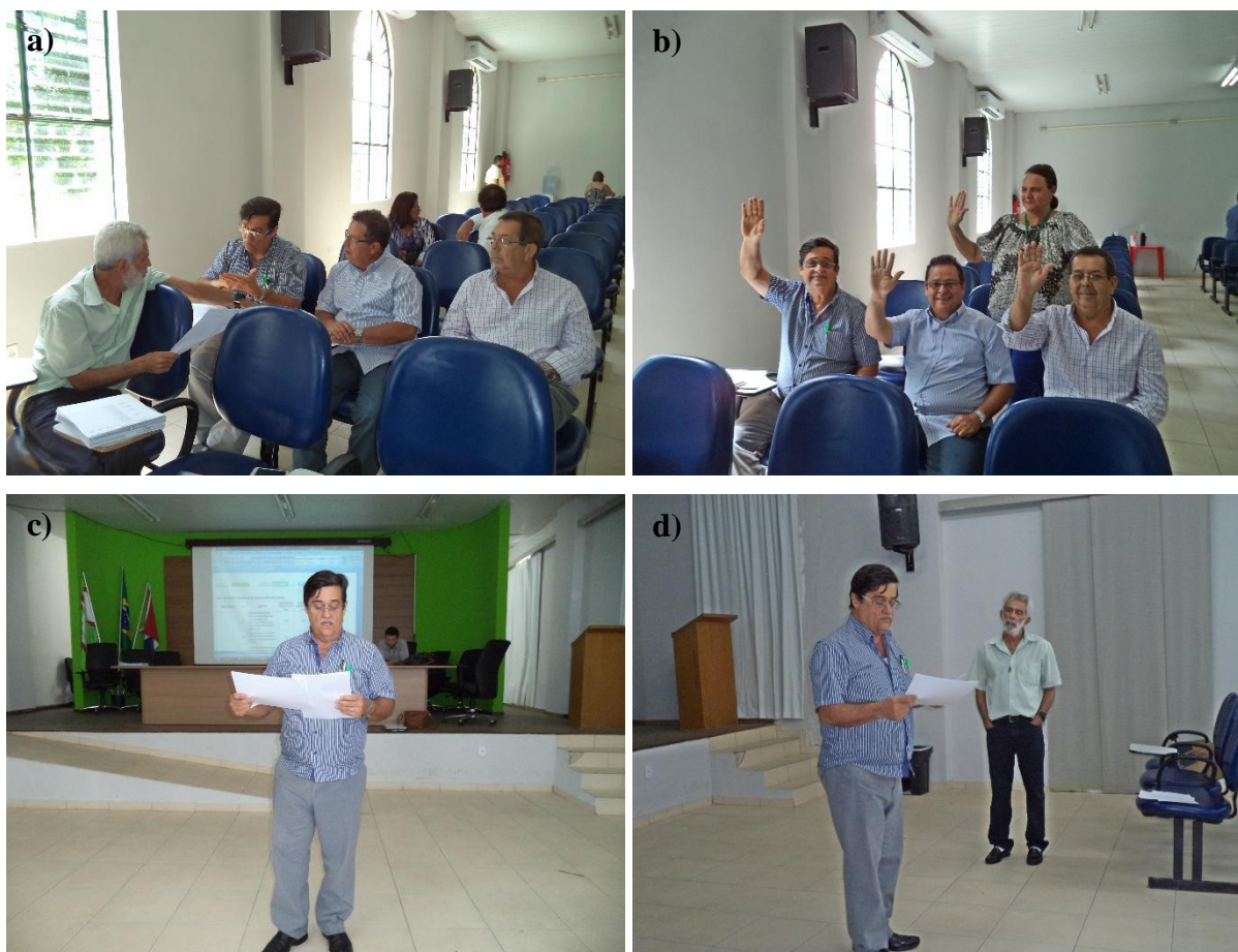
Figura 13, Fotos a) à d) – Registro dos trabalhos do Grupo 2.

O registro com as atividades do grupo 2, incluindo discussão das metas, validação das propostas e apresentação em plenária pode ser visualizado na Figura 13.