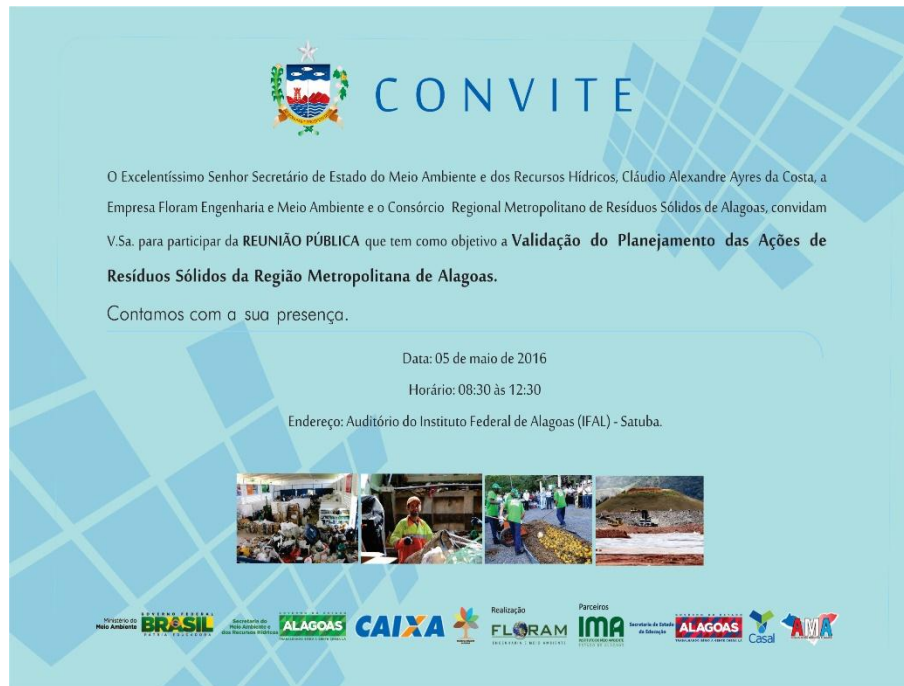
Figura 3 – Modelo do convite impresso específico da Região Metropolitana do Estado de Alagoas.