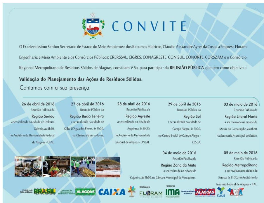
Figura 4 – Modelo de convite especial enviado para instituições de atuação em todo o Estado de Alagoas, contendo, desta forma, a data e locais das reuniões do PIGIRS para as sete regiões de planejamento de resíduos definidas para o Estado.

Além do convite enviado por via postal, também foi realizado o convite através de e-mails. Na Figura 5 é apresentado um dos e-mails enviado pela SEMARH, enquanto que no Anexo 3, constam cópias dos e-mails enviados aos atores de interesse. E na Figura 6 é apresentado um dos e-mails enviados pela FLORAM, enquanto que no Anexo 4, constam cópias dos e-mails enviados aos atores de interesse.