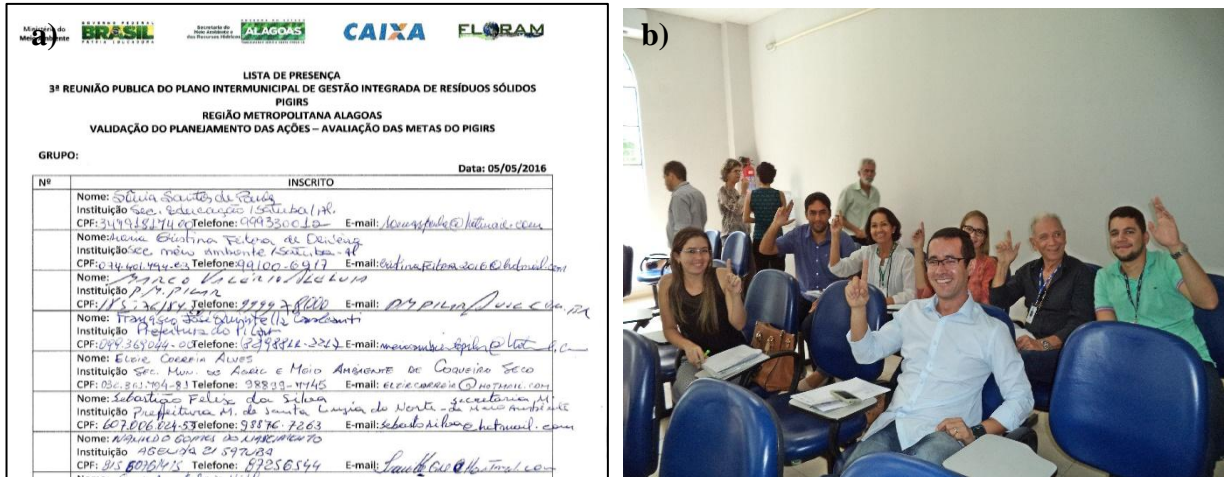
Figura 11, Fotos a) e b) - Modelos dos comprovantes de validação do Planejamento do PIGIRS da Região Metropolitana do Estado de Alagoas, no município de Satuba.

Na Figura 11 é apresentado apenas uns modelos de validação do Planejamento do PIGIRS da região do Metropolitana.