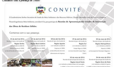
Figura 17– E-mail constando o convite para a reunião do Consórcio, enviado pela SEMARH.