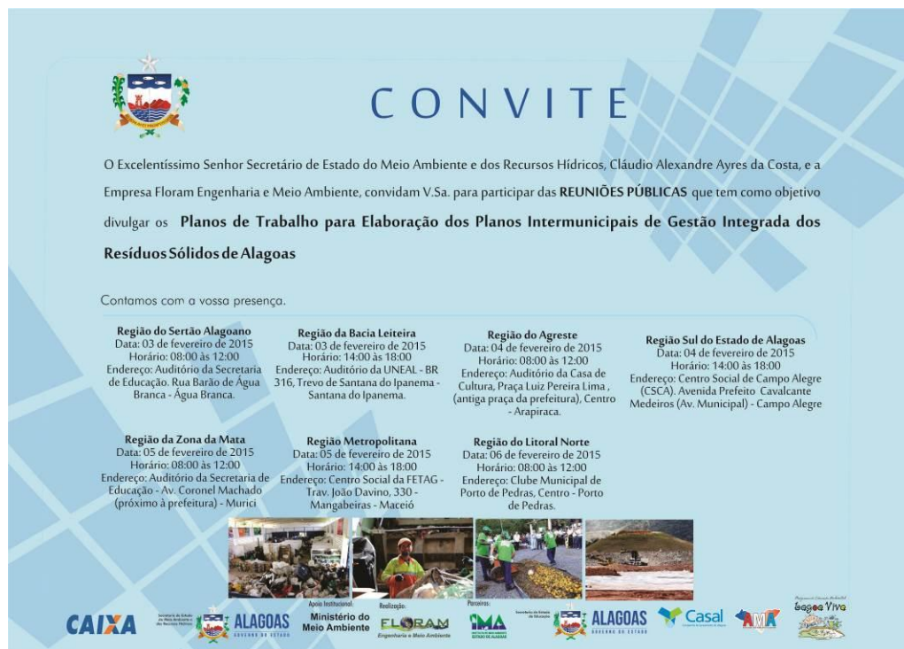
Figura 9 – Modelo de convite especial enviado para instituições de atuação em todo o Estado de Alagoas, contendo, desta forma, a data e locais das reuniões do PIGIRS para as sete regiões de planejamento de resíduos definidas para o Estado.