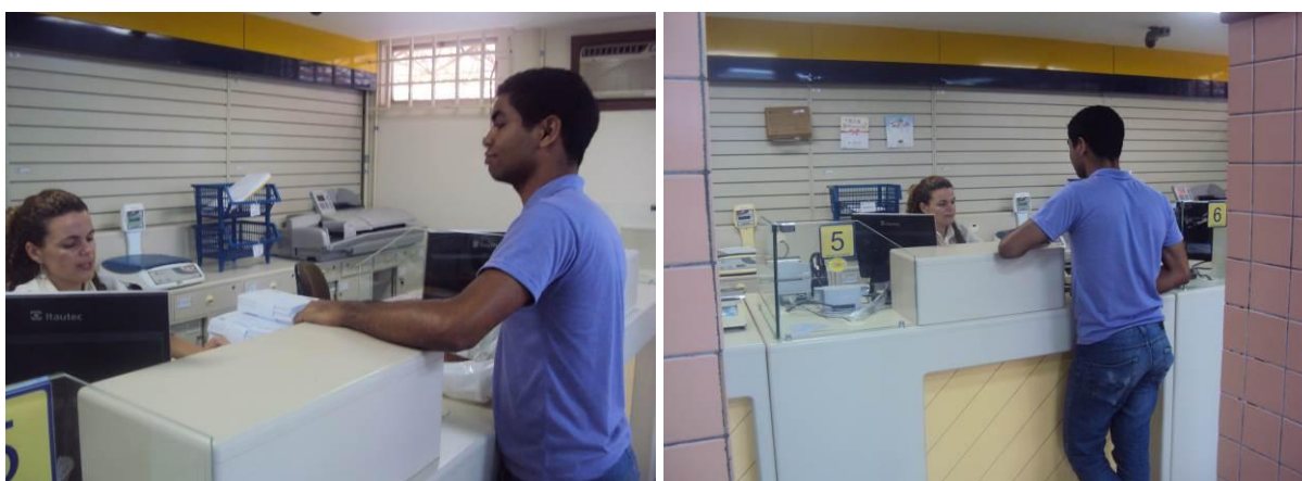
Figura 6 e Figura 7 – Postagens dos convites na Agência dos Correios, no município de Eunápolis, Bahia.

Além dos 200 convites específico da Região Zona da Mata (Figura 8), também foram elaborados convites especiais (Figura 9) que continham as datas das reuniões do FIGIRS considerando as sete regiões de Planejamento definidas para Alagoas. Esses convites foram direcionados a atores de interesse que atuam em todo o Estado ou em mais de uma região, por exemplo: Ibama, CODEVASF, Ministério Público Estadual e Federal, ICMBIO, entre outros. A SEMARH, através de e-mail, também enviou esse convite em formato digital para os representantes das Áreas de Proteção Ambiental – APAs de todo o Estado (Figura 10).