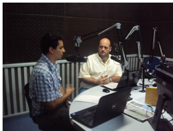
Figura 15 e Figura 16 – Entrevista na rádio Difusora, em Maceió.