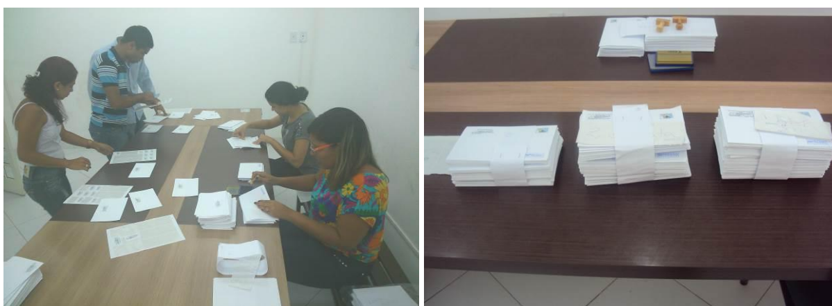
Figura 4 e Figura 5 – Processo de organização dos convites na Sede da Floram, em Eunápolis, Bahia.

Evidências do processo de organização dos convites e seu envio por correio postal, por parte da Floram, são apresentadas nas Figura 4, Figura 4, Figura 6 e Figura 6 e no Anexo 05. Neste anexo também é apresentado o comprovante de envio dos convites por parte da SEMARH.