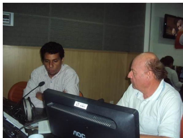
Figura 13 e Figura 14 - Entrevista na rádio Gazeta Web, em Maceió.