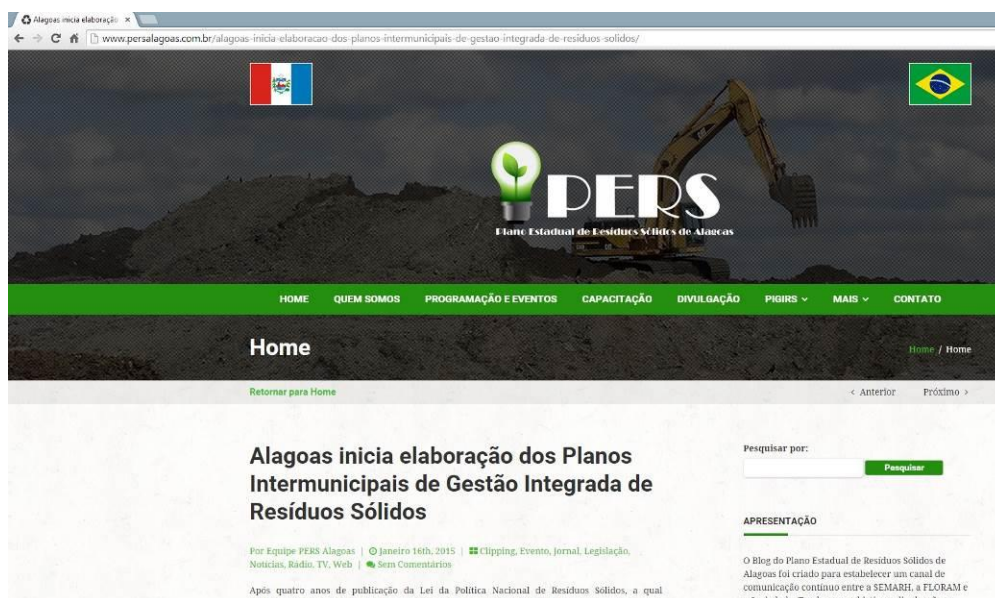
Figura 17 – Recorte da publicação sobre início dos PIGIRS extraída do blog do PERS.

A reportagem pode ser acessada através da página http://www.persalagoas.com.br/alagoas-inicia-elaboracao-dos-planos-intermunicipais-de-gestao-integrada-de-residuos-solidos/ . O recorte da página do blog com o título da publicação é apresentado na Figura 17.