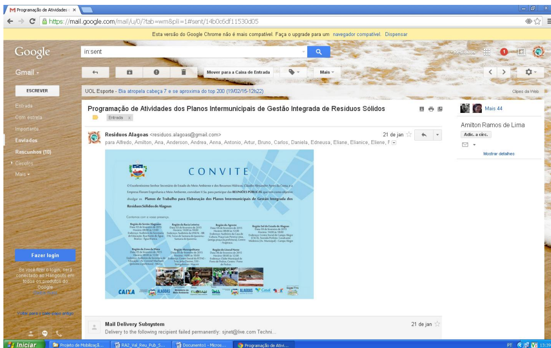
Figura 10 – E-mail enviado pela SEMARH com convite especial para representantes das APAs do Estado.