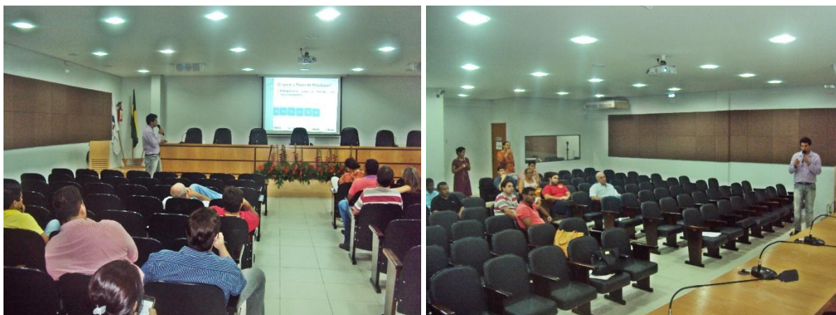
Figura 20 e Figura 21 – Exposição da Apresentação sobre a Elaboração do Plano de Trabalho e Capacitação técnica

Os registros fotográficos da reunião do Comitê Diretor da Região Zona da Mata podem ser visualizados nas Figuras Figura 20 a 21.