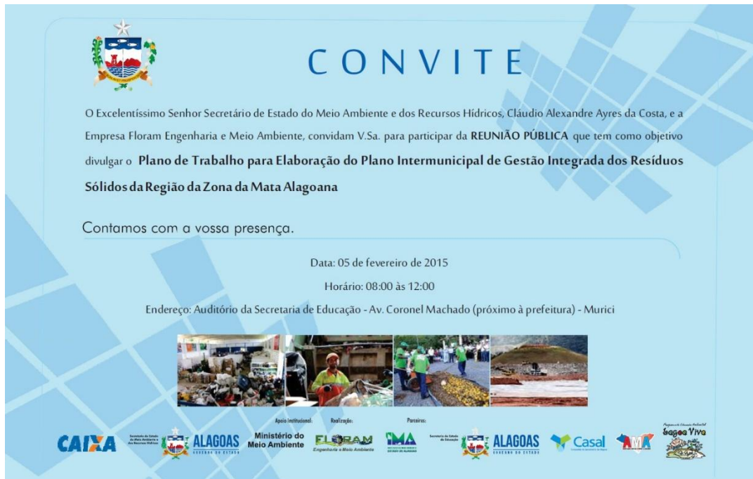
Figura 8 – Modelo do convite impresso específico da Região Zona da Mata do Estado de Alagoas.