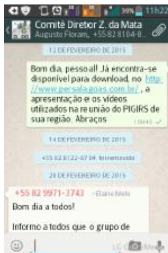
Figura 19 - Grupo “ WhatsApp ” Comitê Diretor Região Zona da Mata.

Outro ponto relevante foi a criação do grupo “Comitê Diretor – Zona da Mata” no aplicativo para smartphones “ WhatsApp ”. Este grupo é composto pelos representantes do Comitê Diretor da Região Zona da Mata e pelos integrantes do grupo técnico de trabalho responsável pelo acompanhamento das atividades, formados por técnicos da SEMARH, IMA, SEE e da Floram.