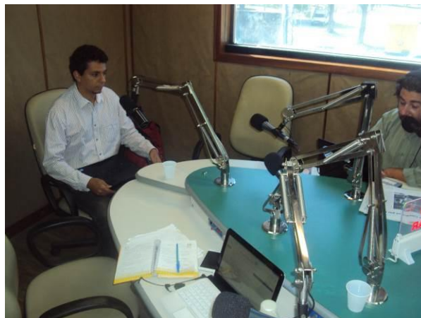
Figura 11 e Figura 12 – Entrevista na rádio Jornal, em Maceió