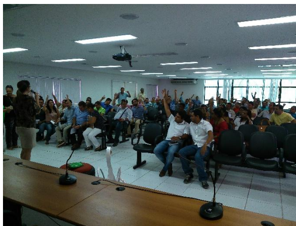
Figura 22 – Validação da apresentação do Plano de Trabalho do FIGIRS da Região Zona da Mata do Estado de Alagoas, no município de Murici.

Com o fim das perguntas a respeito do Plano de Trabalho foi dado prosseguimento a programação, partindo-se, então, para o processo de validação. A validação ocorreu através de aclamação, sendo solicitado aqueles que concordassem com a validação do Plano de Trabalho e tivessem assinado a lista de presença que levantassem a mão. A maioria das pessoas concordou com o processo e validou o documento (Figura 22).